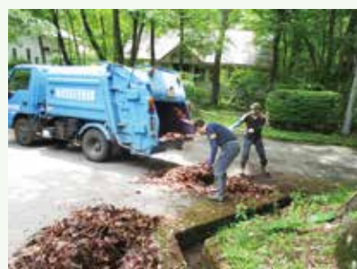
側溝清掃作業中 (上の原高原別荘地)