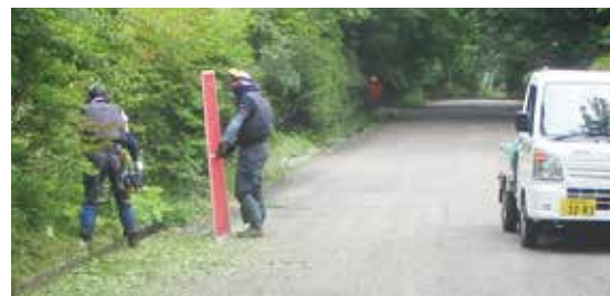
道路路肩の草刈り