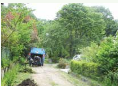
側溝清掃作業中 (那珂川別荘地)