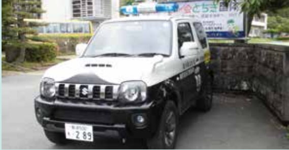
那須町立那須高原小学校