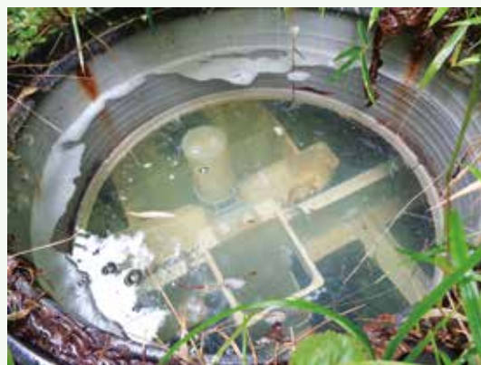
浸透していない浄化槽内部

日々のメンテナンスに加えて、定期的に汲取り清掃することをお勧めいたします。土日祭日も対応いたしますので、是非、当社までお気軽にお問い合わせください。