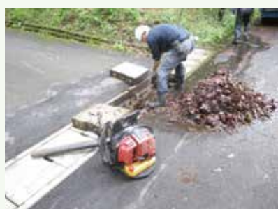
横断溝清掃作業中 (バケーションランド別荘地)