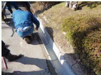
側溝補修工事作業中 (グレートハイランド別荘地)