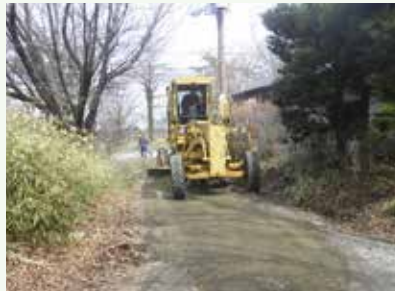
道路補修工事作業中 (第2緑泉苑別荘地)