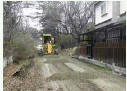
道路補修工事作業中 (景勝苑別荘地)