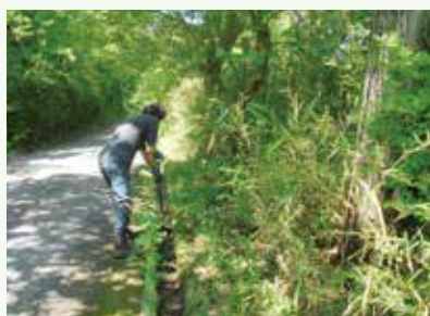
側溝清掃作業中 (桜台別荘地)