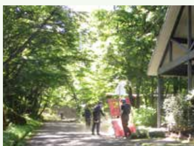
道路路肩の道刈作業中 (バケーションランド別荘地)