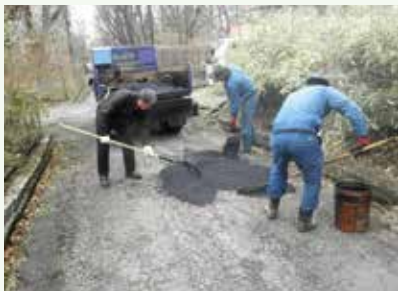
道路補修工事作業中 (第1新那須高原別荘地)