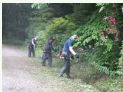
道路路肩の道刈作業中 (上の原高原別荘地)