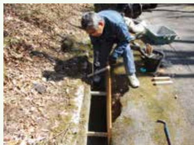
側溝補修工事作業中 (バケーションランド別荘地)