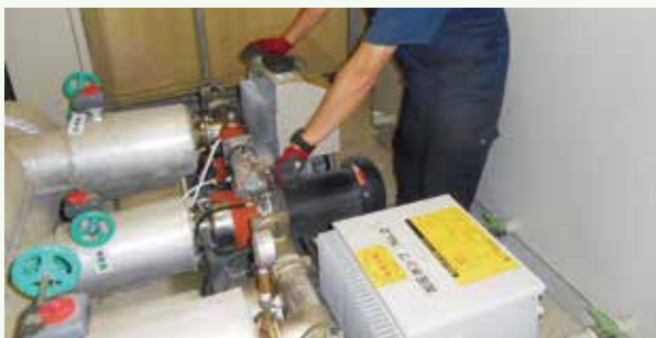
給水ポンプユニット作業中 (那珂川別荘地)