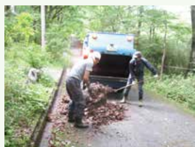
側溝清掃作業中 (バケーションランド別荘地)