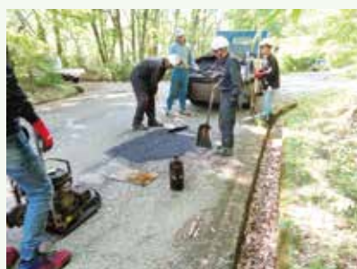
道路補修工事作業中 (上の原高原別荘地)