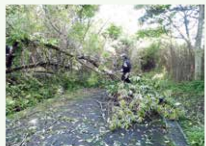
倒木処理作業中 (レークサイド別荘地)