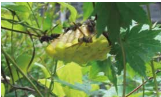
草木の中につくられた蜂の巣

例年夏は野生動物（熊・イノシシ・サル等）の活動が活発となる時期でございますが、今年は6月位から蜂の巣のご相談を多くいただいております。既に駆除のご依頼も承っておりますので、ご注意ください。