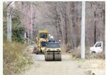
道路補修工事作業中 (景勝苑別荘地)