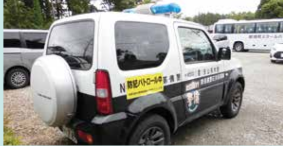
那須町立田代友愛小学校