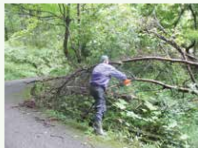
倒木処理事業中 (バケーションランド別荘地)