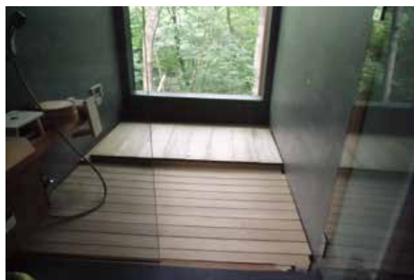
檜風呂と浴室内部