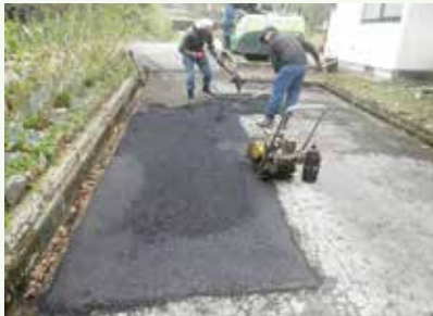
道路補修工事作業中 (那珂川8期別荘地)