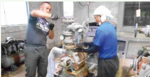
タービンポンプバルブ・逆止弁交換工事 (長南寺別荘地)

皆様に安全・安心なお水の供給に努めさせていただきますので、ご協力の程、よろしくお願いいたします。