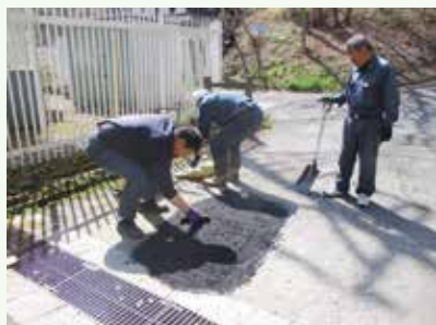
道路補修工事作業中 (バケーションランド別荘地)