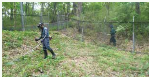
水道施設内草刈り作業実施 (桜台別荘地)