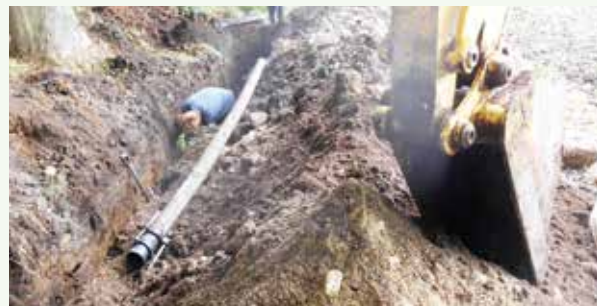
水源から配水施設への送水管漏水修理工事 (景勝苑別荘地)