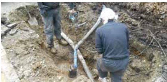
給水管漏水修理・維持管理