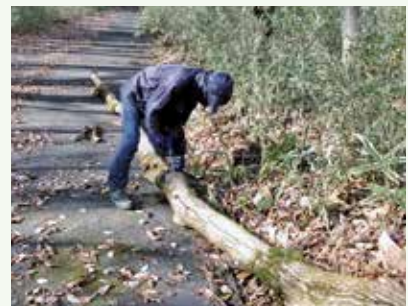
倒木処理 作業中 (吉野台別荘地)