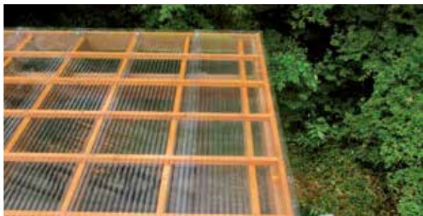
デッキ屋根張替え工事 完了