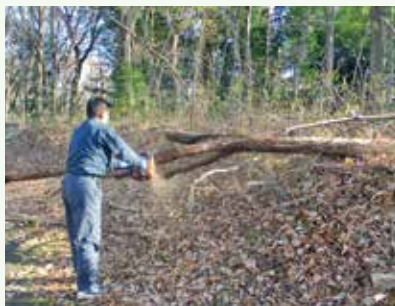
倒木処理 作業中 (長南寺別荘地)