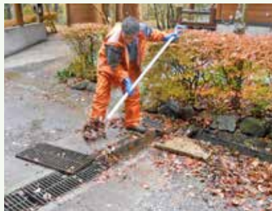
側溝落葉清掃 作業中 (那珂川18期別荘地)