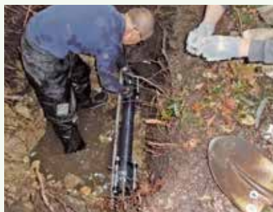
給水管漏水修理工事 作業中 (景勝苑別荘地)