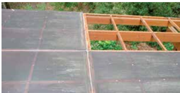
古いデッキ屋根の剥し工事 作業中

別荘のご利用が多くなる春に向けて、快適にご利用されるためにも、是非、ご検討下さい。