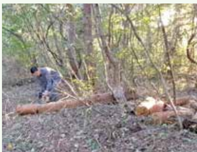
倒木処理 作業中 (湯の里村別荘地)