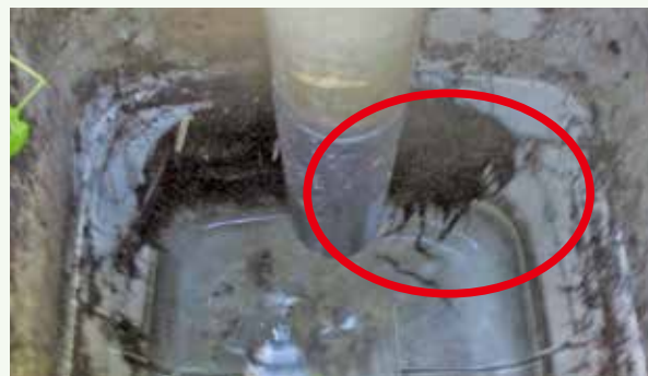
浄化槽内部に入り込んだ木の根