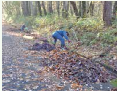
側溝落葉清掃 作業中 (桜台別荘地)