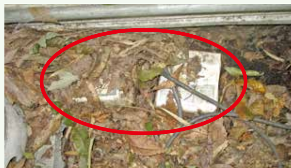
土砂等に埋もれたブロワー機器