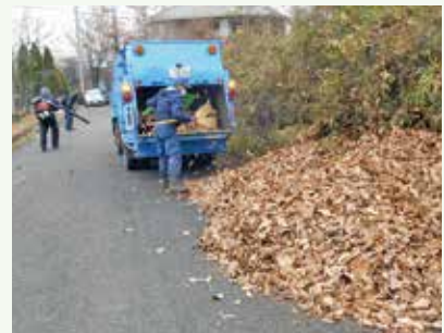
側溝落葉清掃 作業中 (レークサイド別荘地)