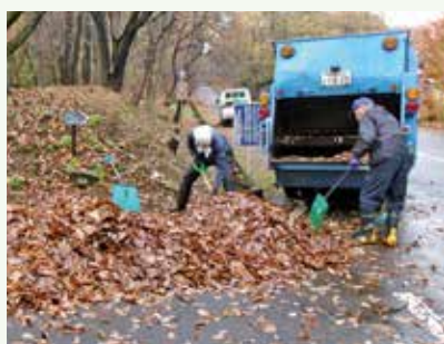
側溝落葉清掃 作業中 (バケイションランド別荘地)