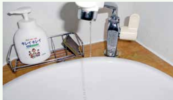
水道の凍結防止のために、細く水を流す例 (水量の目安は太さ3mm位)