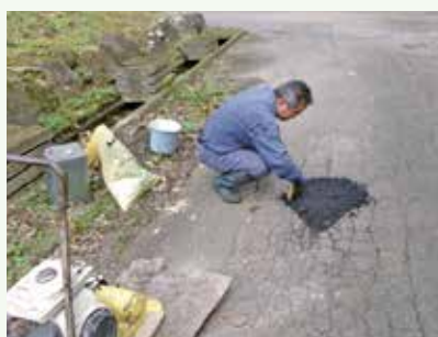
道路補修工事 作業中 (上の原高原別荘地)