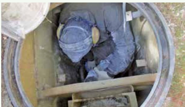
浄化槽内部の修繕工事 作業中