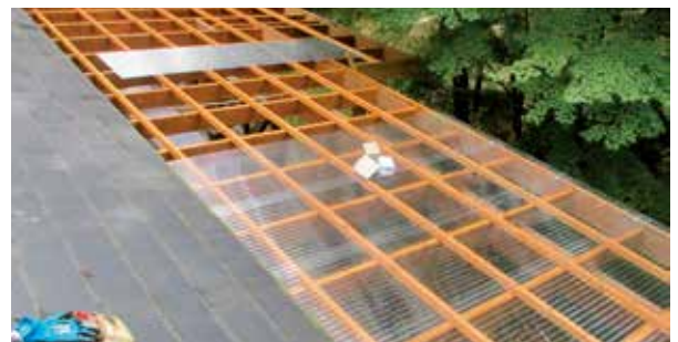
デッキ屋根の張替え工事 作業中