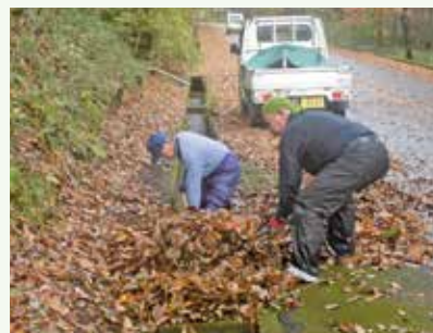
側溝落葉清掃 作業中 (バケイションランド別荘地)