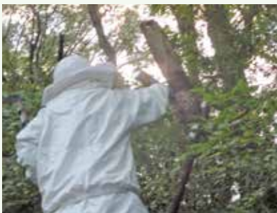
防犯街路灯の蜂の巣駆除 作業中 (グレートハイランド別荘地)