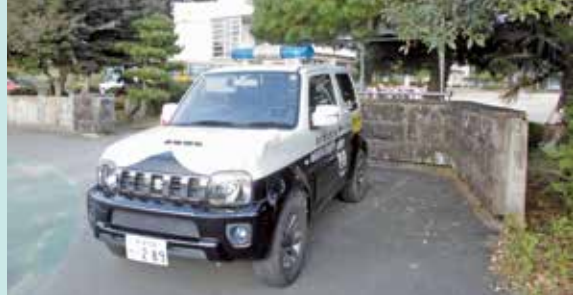
那須町立那須高原小学校

令和5年11月7日当社の長年にわたる「通学防犯パトロール隊」の活動を称えられ、栃木県知事より感謝状をいただきました。