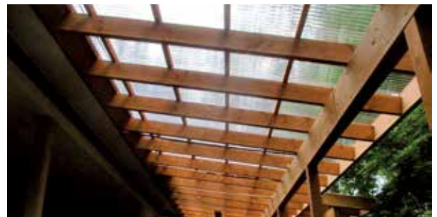
デッキ屋根張替え工事 完了