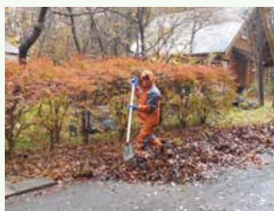
側溝落葉清掃 作業中 (上の原高原別荘地)