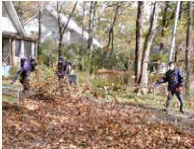
落葉清掃 作業中 (グレートハイランド別荘地)