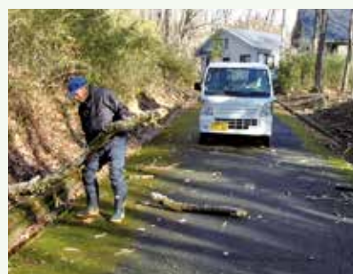
強風後の落枝処理 作業中 (バケイションランド別荘地)