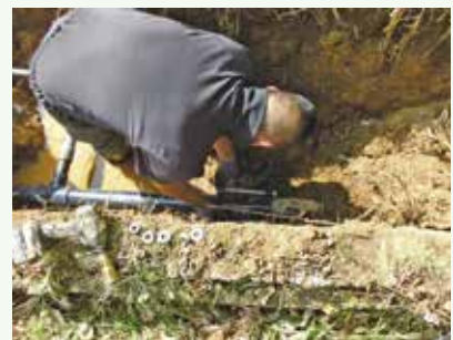
給水管漏水修理工事 作業中 (那珂川別荘地)