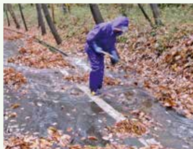
大雨時の側溝落葉清掃 作業中 (バケイションランド別荘地)