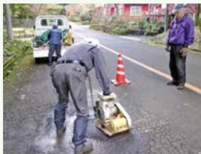
道路補修工事 作業中 (バケイションランド別荘地)