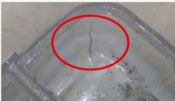
浄化槽内部の亀裂状況

長年堆積した落葉や土砂により、浄化槽や付帯設備が埋もれて見つけられない場合もありました。当社では浄化槽の適正な管理を行い、本来の機能を発揮できるようにお手伝いさせていただきますので、お気軽にお問い合わせください。