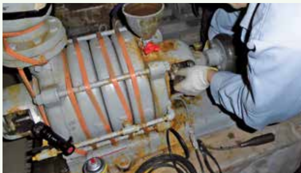
タービンポンプグランドパッキン交換 作業中 (長南寺別荘地)

今年も皆様に安全・安心なお水の供給に努めますので、更なるご理解・ご協力をお願い申し上げます。