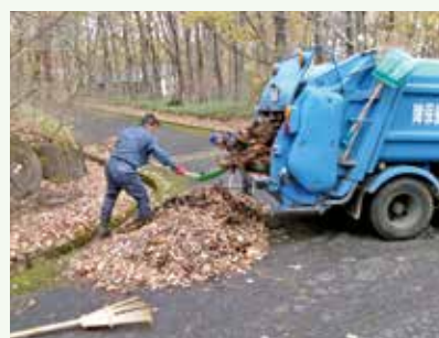
側溝落葉清掃 作業中 (上の原高原別荘地)