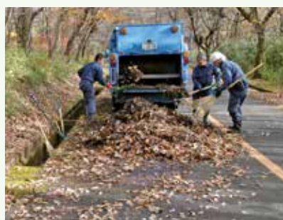
側溝落葉清掃 作業中 (バケイションランド別荘地)