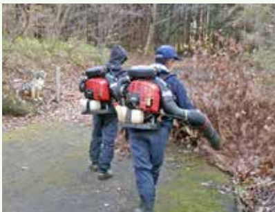
落葉清掃 作業中 (吉野台別荘地)