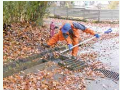
側溝落葉清掃 作業中 (第2緑泉苑別荘地)