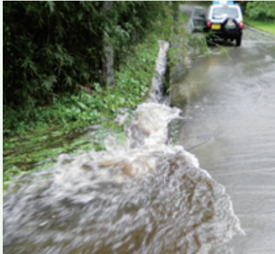
台風通過中（グレートハイランド）

9月15日から台風18号による大雨、強風の為、管理別荘地各地において、側溝のあふれや、一部砂利が流されたり倒木などの被害がありました。建物への大きな被害はございませんでした。