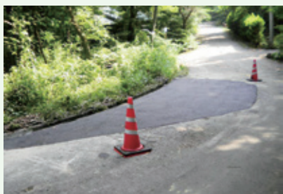
道路補修工事後 (8月9日撮影)