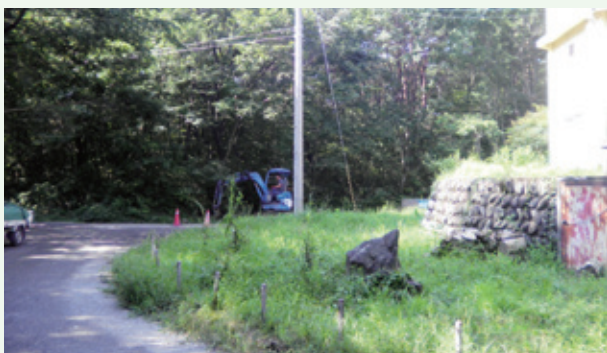
配水管漏水修理工事（鷹の台）