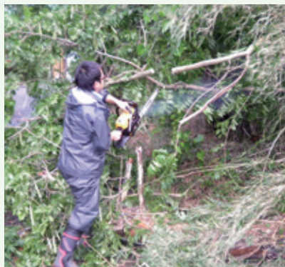
倒木撤去作業（9月16日撮影）