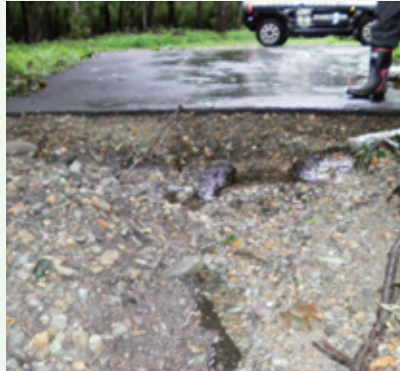
台風通過後（グレートハイランド）