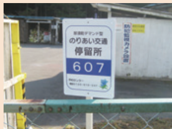
バケーションランド別荘地内停留所