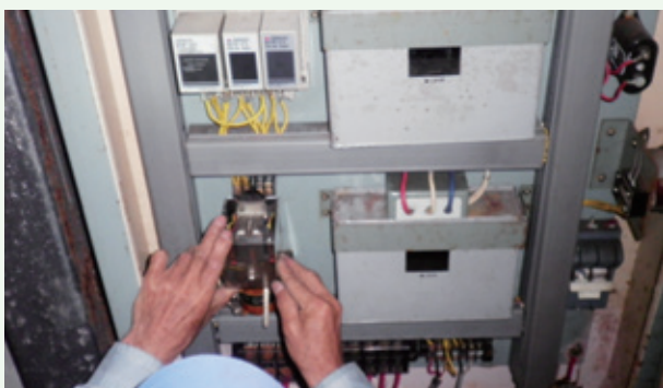
配水施設の機械制御のメンテナンス（鷹の台）