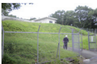
水道施設の環境整備

別荘地の醍醐味である砂利道も、車の通行により砂利が減っていきます。追加、補修を行います。