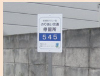
五峰苑別荘地内停留所