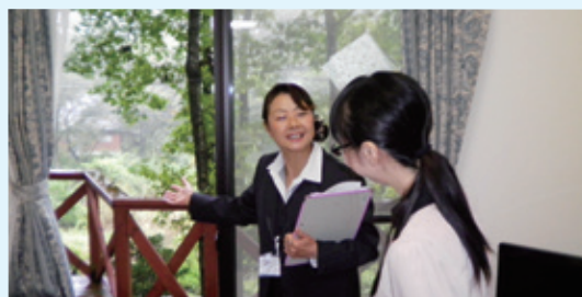
物件のご案内を致します。

日に日に秋が深まる季節となりました。皆様には誠にありがとうございます。皆様のご健康のこととお慶び申し上げます。平素は格別のご高配をいただきまして、厚く御礼申し上げます。