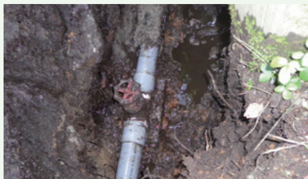
配水管止水バルブ修理工事（鷹の台）