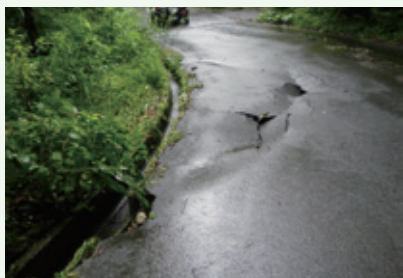
被害状況 (8月6日撮影)

8月上旬の集中豪雨により、別荘地の一部アスファルトが破損するなどの被害が発生致しましたが、早急に現状を確認して、復旧工事を行いました。