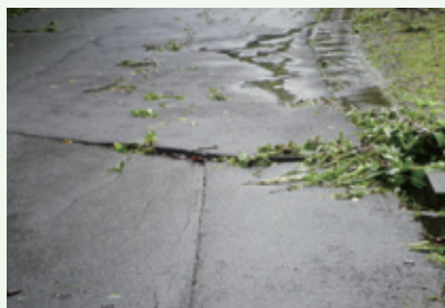
被害状況 (8月6日撮影)