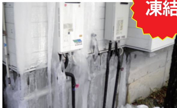
昨冬発見した、凍結破裂した給湯器（未管理別荘）