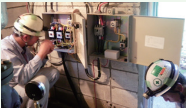
水源施設の制御盤メンテナンス（景勝苑）

水道施設の制御盤や機械制御装置のメンテナンスを日常的に行い、古い部品の順次更新をしております。又、漏水の発見や補修工事を行って施設への負担を軽減する様に努めております。水道施設や配水管を維持するためには、共益施設維持管理協力金の一部を使用させて頂いております。皆様に安全・安心な水の供給に努めさせて頂きますので、ご協力の程宜しくお願い申し上げます。