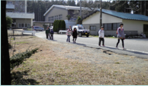
那須町立田代小学校