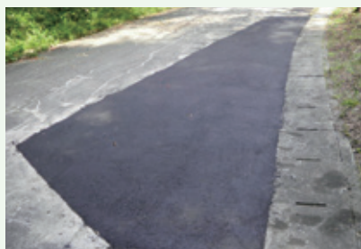
道路補修工事後 (8月9日撮影)