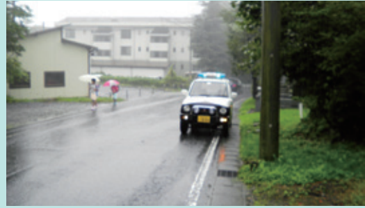
那須町立那須小学校