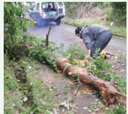
倒木撤去作業（9月16日撮影）