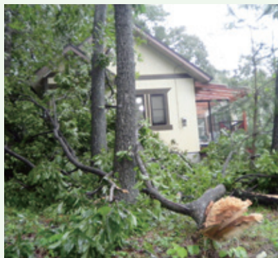
被害状況（9月16日撮影）

竜巻の影響で、グレートハイランド別荘地内では、倒木などの被害が有りました。現状を確認して被害を受けられたオーナー様へのご連絡と、早急に復旧工事を行いました。