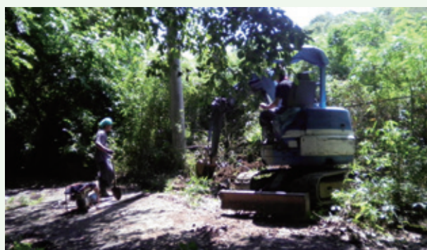
配水管漏水修理工事（豊原）