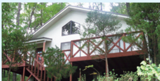
さまざまな物件を取り扱っております。