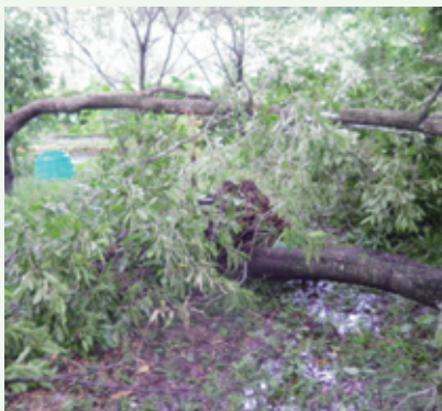
被害状況（9月16日撮影）