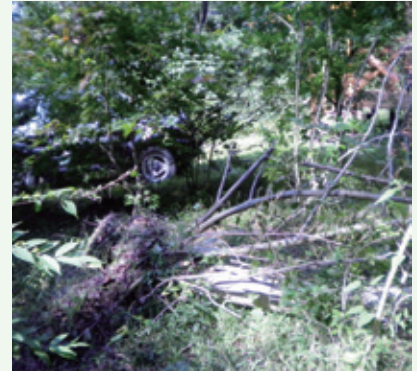
倒木（バケーションランド）