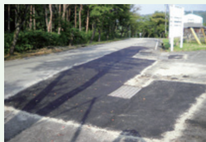
道路補修工事後 (8月9日撮影)