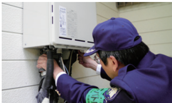
給湯器の水抜き作業中