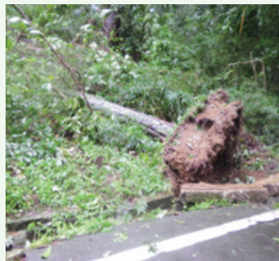
被害状況（9月16日撮影）