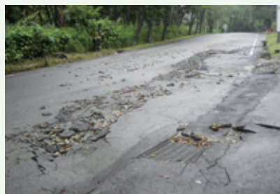
被害状況 (8月6日撮影)