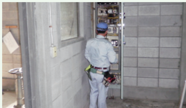
配水施設の機械制御のメンテナンス（八方高原）