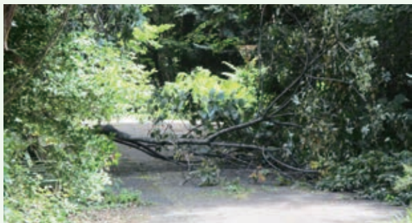
9月29日 倒木発見（湯の里村）