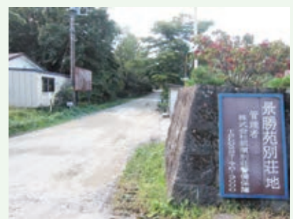
砂利入れ工事完了（景勝苑）