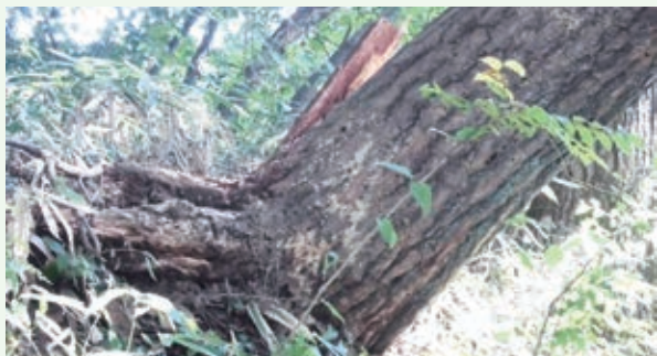
9月10日 倒木発見（第二緑泉苑）

今年9月18日大型台風18号通過後の強風による倒木等がありました。また9月28日大雨後にも同様の被害があり、緊急処置として対応いたしました。