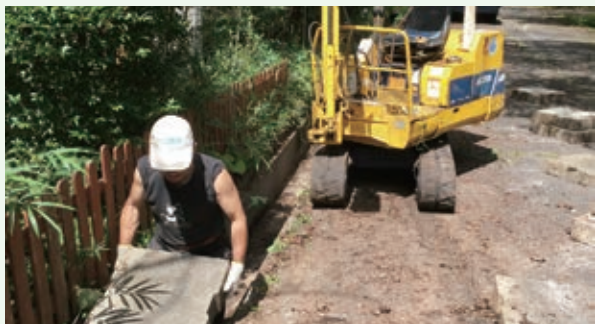
清掃作業中（バケーションランド）