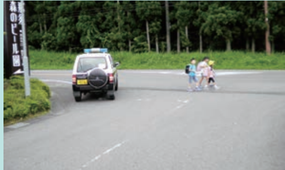
那須町立田代友愛小学校