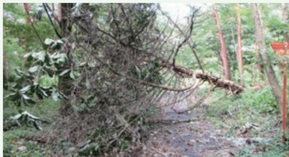
9月18日 倒木発見（湯の里村）