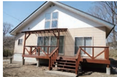
リフォーム済物件が人気です!!

今後も多くの方々のご要望にお応えできるように努力して参ります。お気軽に当社までご相談ください。