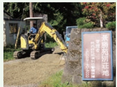
砂利入れ工事（景勝苑）