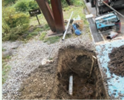
漏水修理工事 (那珂川八期)