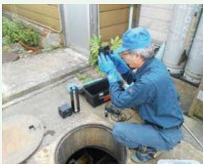
浄化槽点検 水質検査