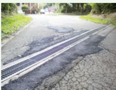
横断溝補修工事(グレートハイランド)