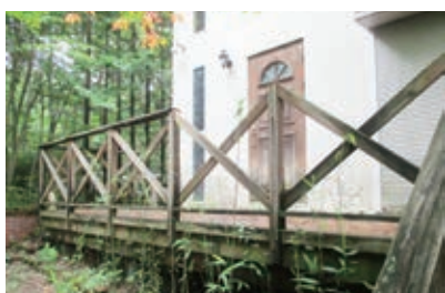
リフォーム工事前 玄関前

長年の経年劣化の為、玄関ドアを交換して、玄関廻りのサイディング張替をしました。玄関内部とデッキは補修工事して、建物廻りに生い茂った樹木の伐採をして、屋根にテレビアンテナ等を設置し、日当たりの良い環境となりました。