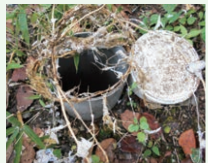
詰まっていた木の根の除去