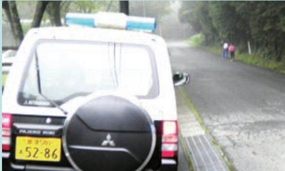
那須町立那須小学校