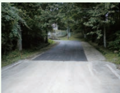
道路補修工事（グレートハイランド）