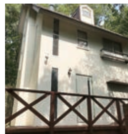
リフォーム工事完了 外観

別荘リフォーム工事のことなら、何でもお問い合わせください。 お問い合わせ TEL 0287-76-7588 リフォーム部まで