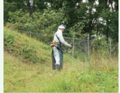
水道施設の環境整備 (バケーションランド)