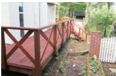
リフォーム工事完了 玄関前