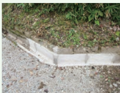
側溝補修工事完了（第二緑泉苑）