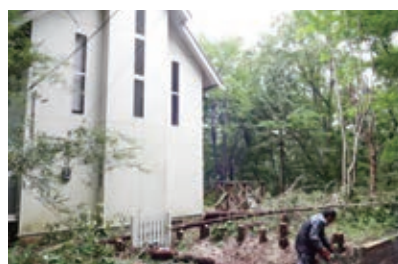
敷地内伐採工事中