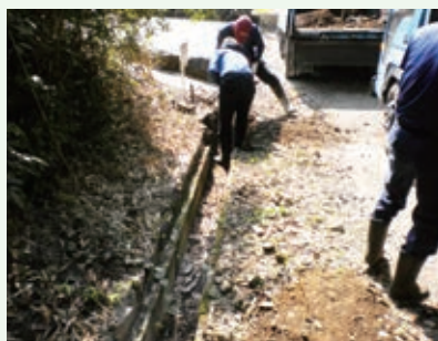
側溝補修工事（第二緑泉苑）