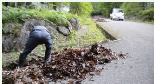
清掃作業中（上の原高原）