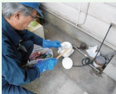
浄化槽ブローアークリーニング