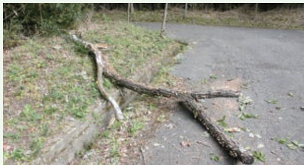
10月10日 倒木発見（グレートハイランド）

※別荘地も開発されて50数年が経過し、樹木も大きくなり倒木の恐れのある木も増えております。 日当たりの確保や倒木による事故防止のためにも、伐採をご検討ください。