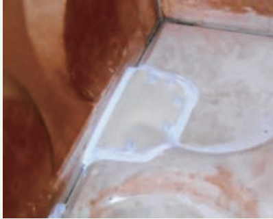
貯水槽内亀裂修理 (グレートハイランド)