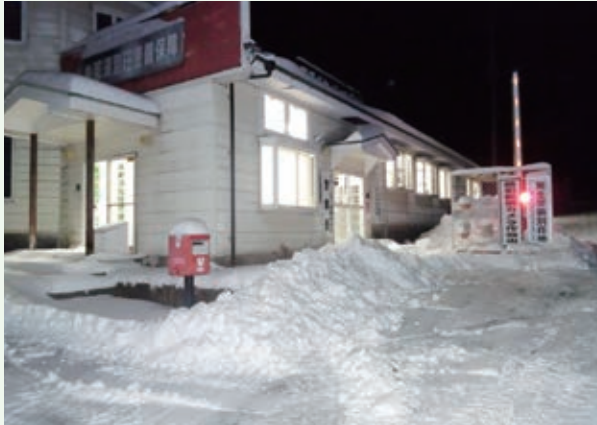
バケーションランド事務所（午前 3 時頃撮影）

那須高原も例外では無く、当社の除雪作業は昨年12月27日から始まり、12月は4日間、今年1月は12日間、2月は9日間の合計25日間の除雪車稼動を実施いたしました。