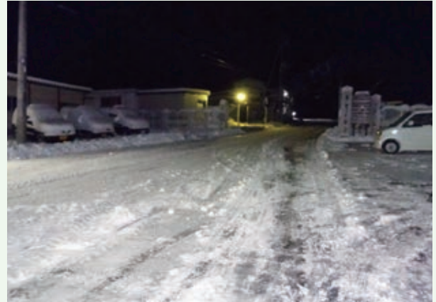
バケーションランド内（午前 3 時頃撮影）