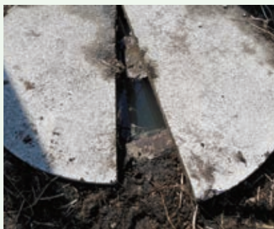
浸透槽から水が溢れている状況