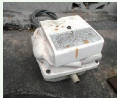
ばっ気用ブロワの交換