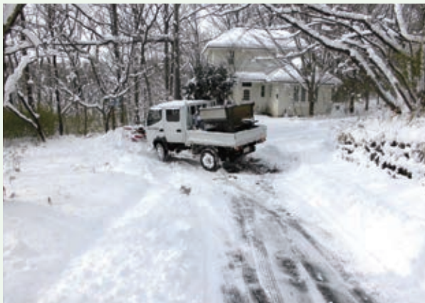
除雪作業（バケーションランド）