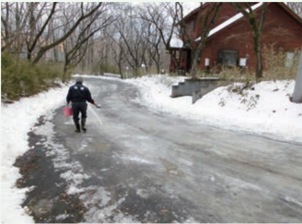
融雪剤散布作業（バケーションランド）

道路を除雪しても、今年1月中頃以降は連日の冷え込みにより、道路の薄氷が日中でも溶けない状況が続き、車輛のスリップ等のトラブルが多発いたしました。当社では手作業で融雪剤を散布したり、道路脇の雪を移動させて道幅を広くするなどの作業を実施いたしました。