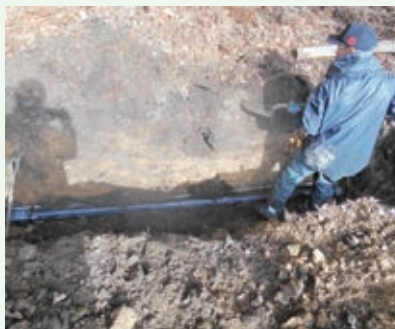
送水管の漏水修理工事(景勝苑)