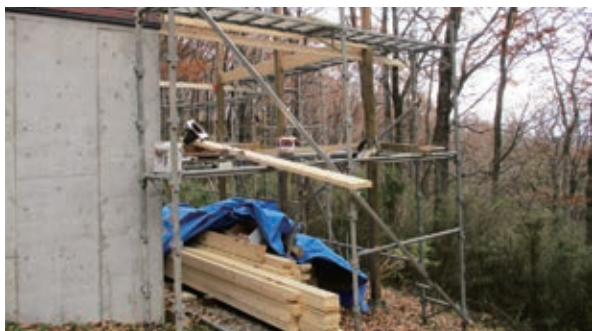
足場を設置して工事開始