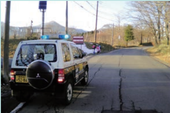
那須町立那須小学校