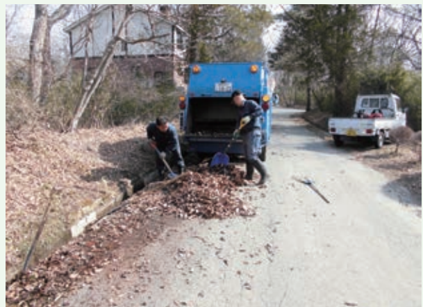
側溝清掃（グレートハイランド）