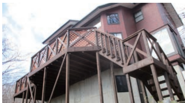
工事完了 下部からの写真

別荘リフォーム工事のことなら、何でもお問い合わせください。 お問い合わせ TEL 0287-76-7588 リフォーム部まで