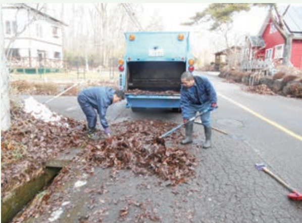
側溝清掃（バケーションランド）

今年は雪以外でも強風や大雨等の悪天候が続き、別荘地内の側溝等のあふれがございました。順次対応しておりますので、ご理解とご協力をお願い申し上げます。