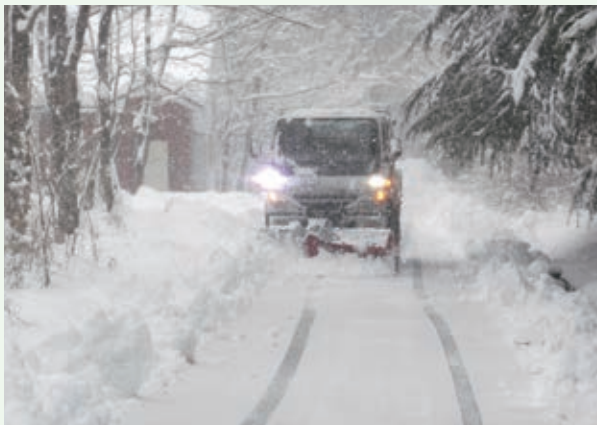
除雪作業（上の原高原）