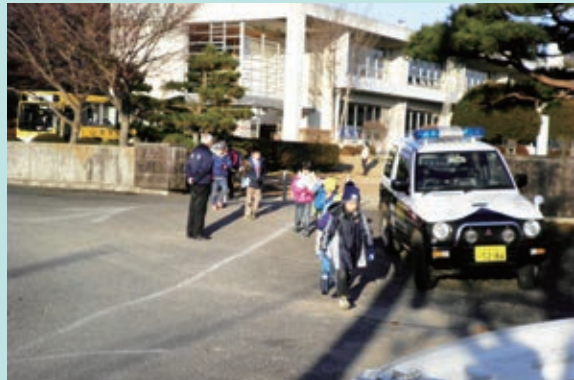
那須町立那須高原小学校