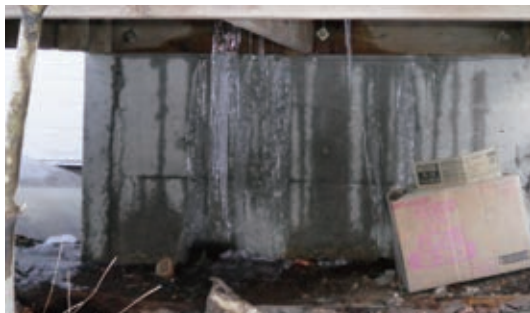
建物内部からの漏水

水出し作業が終わっても、設備機器の安全のため、別荘不在時は水道の元栓を閉めておきますが、当社に連絡をいただかないままに水道の元栓を開くと、建物内部が漏水する場合がありますので、お手数ですがお越しの際とお帰りの際には、必ず管理事務所までご連絡をお願いいたします。