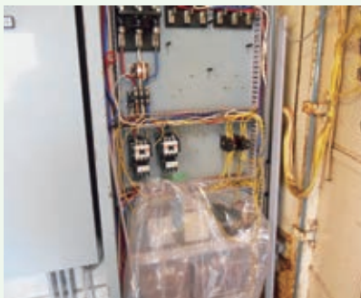
配電盤内の部品交換作業(景勝苑)

貴重な水資源でございます。節水にご協力をお願い申し上げますと共に、皆様に安全・安心なお水の供給に努めさせていただきますので、ご協力の程、宜しくお願い申し上げます。