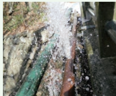
送水管の漏水(上の原高原)