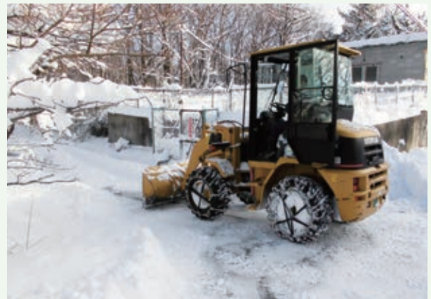
除雪作業（バケーションランド）