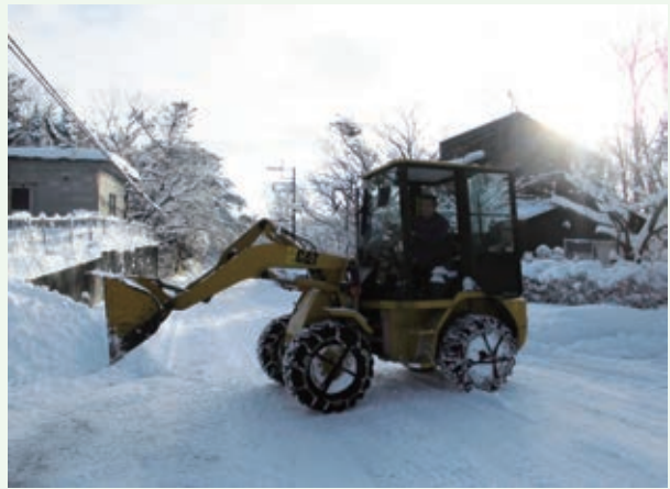
除雪作業（バケーションランド）