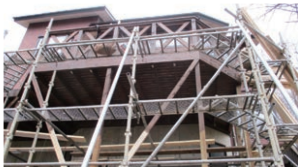
工事中 下部からの写真